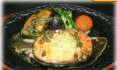
サーモンステーキバターソース ¥1,500