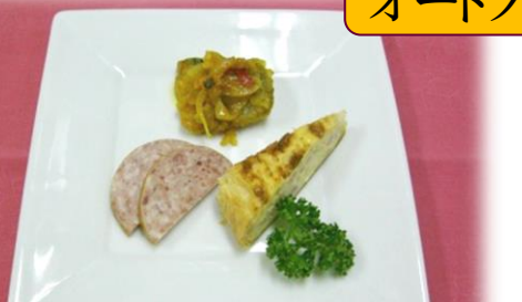
オードブル盛合せ ¥800