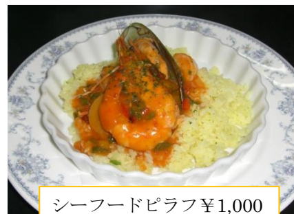
シーフードピラフ ¥1,000