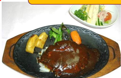
ハンバーグステーキ ¥1,700