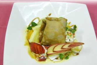
クレープ(フルーツ) ¥600