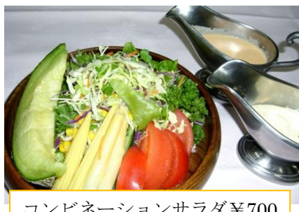
コンビネーションサラダ ¥700