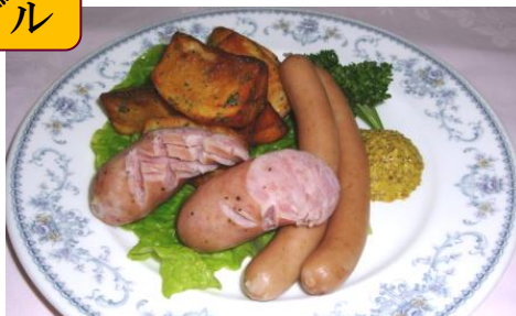
ドイツソーセージとフライドポテト添え ¥1,000