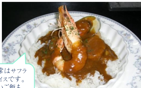
シーフードカレー ¥1,200