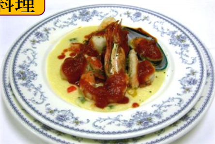
海の幸盛合せ 2色ソース ¥1,800