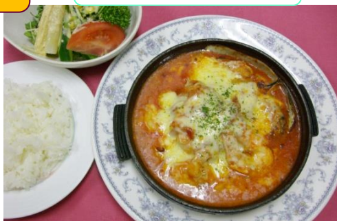
海老と帆立貝のチーズ焼グラタン ¥1,700